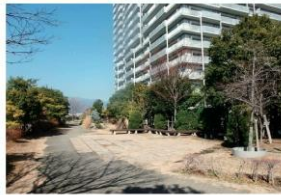
☀️ マンション脇の遊歩道