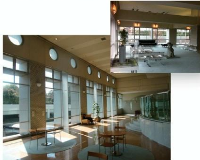
☀️ 陽光差し込む共用ラウンジ