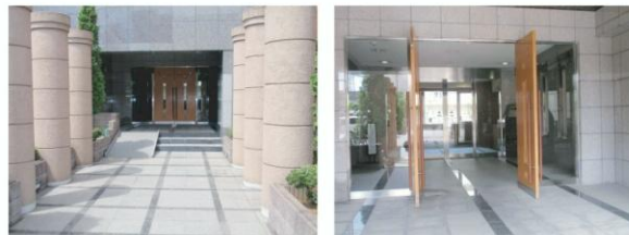
※図面と現況が異なる場合は現況を優先します